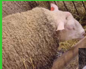
Berrichon du cher