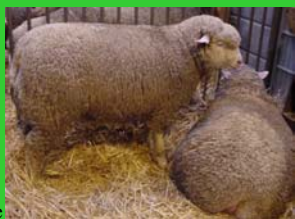
Ile de France