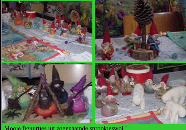
Mooie figuurtjes uit zogenaamde sprookjeswol !