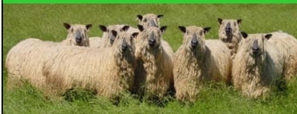
Wensleydale Longwool Sheep

Alle Engelse witkoppige rassen met lange wol, zoals de Leicester, Border Leicester, Lincoln, Romney Marsh, en de derivaten van deze rassen op het Europese vasteland (bv. Texel, Duitse Witkoppen, Charollais,...)