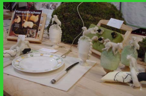
Eierwarmers uit schapenwol.